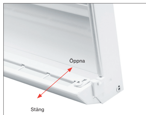
Spjället regleras enkelt med fingertopparna. Bilden visar spjället i öppet läge